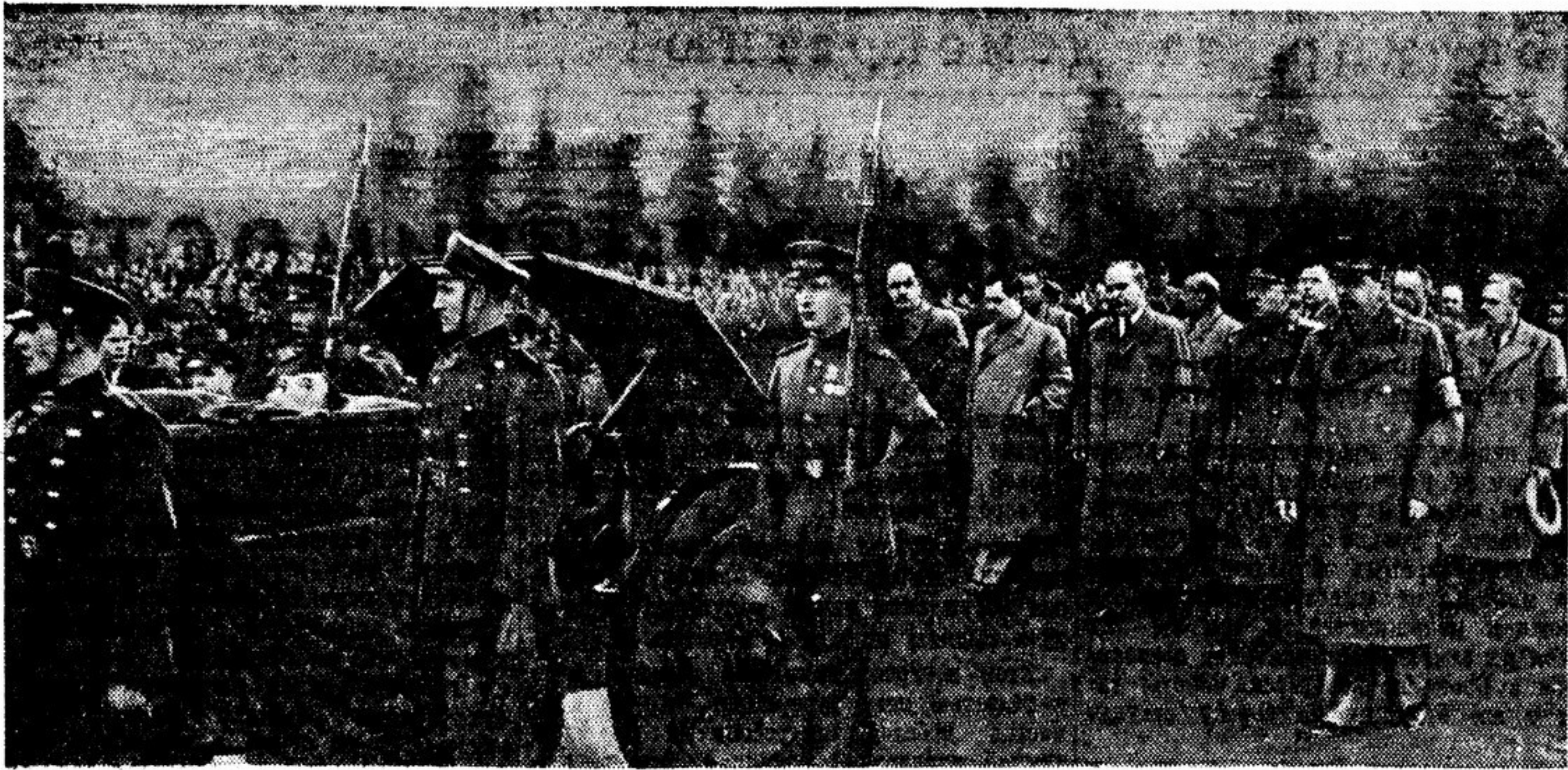
Похороны Андрея Александровича Жданова. Траурная процессия на Красной площади. За гробом идут товарищи (слева направо): Л. М. Каганович, Г. М. Маленков, А. Н. Косыгин, А. И. Микоян, В. М. Молотов, Л. П. Берия, К. Е. Ворошилов, Н. А. Вознесенский, И. В. Сталин, Н. М. Шверник, А. А. Андреев и другие.